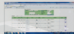
全て Web ブラウザ上で運用